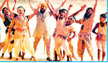
ग्रामीण परिवेश पर बनी हिट फिल्म 'लगान'

फिल्म आई, पर इसमें भी गांव मूल रूप में नहीं दिखा। कुछ साल पहले 'पीपली लाइव' आई थी, जो गांव की सच्चाई और समस्याओं वाली फिल्म थी। इसमें किसानों के लिए बनी योजनाओं को बाबुओं और अफसरों द्वारा हड़पने का जिक्र ज्यादा था। लेकिन बड़े तबके को यह फिल्म समझ में ही नहीं आई सो आर्थिक रूप से फायदेमंद नहीं रही।