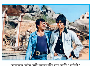
रामगढ़ गांव की पृष्ठभूमि पर बनी 'शोले'

ग्रामीण फिल्मों का था सुनहरा दौर: सिनेमा का एक दौर ऐसा भी आया था, जब गांव और गांव वाले ही सिनेमा की पहचान हुआ करते थे। लेकिन जैसे-जैसे सिनेमा का बाजार बढ़ा, परदे से गांव गायब होते गए। फिल्मों का इतिहास टटोला जाए, तो शुरुआती फिल्मों का कथानक गांव की पगडंडियों से होकर ही गुजरता। वी. शांताराम की 'दो बीघा जमीन', विमल रॉय की 'बादगा' और 'बंदिनी', राज कपूर की 'आवारा', 'श्री 420' और 'बूट पॉलिश' ग्रामीण परिवेश की ऐसी फिल्में थीं, जिन्होंने देश और दुनिया को वहां की समस्याओं और उनके जीवन से रूबरू करवाया था। गांव के जीवन पर बनीं इन फिल्मों में एक अलग सी महक होती थी।