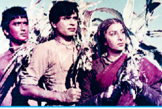
'मदर इंडिया' में दिखा वास्तविक ग्राम्य जीवन