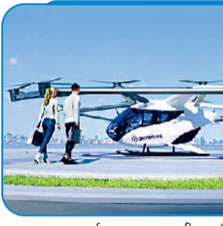
स्काई ड्राइव, जापान की एयरटेक्स

कई स्तरों पर हो रही तैयारी: साल 2025 के अंत तक दुनिया भर में कई कंपनियां ऐसी