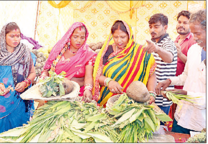
रोहतक। छठ पर्व के लिए खरीदारी कर रहे श्रद्धालु।

आस्था का महापर्व छठ नहाए-खाए के साथ धूमधाम से शुरू हो गया। चार दिवसीय इस उत्सव में श्रद्धालुओं ने पारंपरिक स्नान कर व्रत का संकल्प लिया। महिलाओं ने सब्जों का प्रसाद ग्रहण कर मन की शुद्धता और सूर्य उपासना की तैयारियां आरंभ कीं।