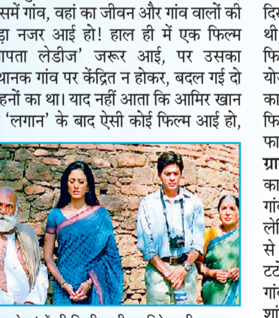
'स्वदेश' में भी दिखी ग्रामीण परिवेश की झलक

हाल के वर्षों में आई हिंदी फिल्मों की बात करें तो उसमें गांव और ग्रामीण परिवेश की कहानियां बिल्कुल गायब रही हैं या न के बराबर ही नजर आई हैं। कथानकों से गांव विलुप्त होने का मतलब है, देश की 60% आबादी सिनेमा से गायब हो गई। अब जो फिल्में बनाई जा रही हैं, उनकी कहानियां 40% शहरी आबादी पर केंद्रित रहती हैं। इस सच्चाई को भी नकारा नहीं जा सकता कि गांव के जीवन की कहानियों से हिंदी सिनेमा का बॉक्स ऑफिस समृद्ध नहीं हो सकता। लेकिन समानांतर सिनेमा का तो मूल आधार ही ग्रामीण पृष्ठभूमि होती है, उसे ही इन कहानियों का प्रतिबिंब कहा जाता है। 'अंकुर', 'पार', 'दो बीघा जमीन', 'सूरज का सातवां घोड़ा' और 'अंतर्नाम' जैसी फिल्में ग्रामीण भारत का प्रतिनिधित्व करने में सफल रहीं। लेकिन अब ऐसी फिल्में भी नहीं बनती हैं। गांवों से दूर हो रही फिल्में: याद कीजिए कि पिछले कुछ सालों में ऐसी कोई नई फिल्म देखी, जिसमें गांव, वहां का जीवन और गांव वालों की पीड़ा नजर आई हो! हाल ही में एक फिल्म 'लापता लीडोज' जरूर आई, पर उसका कथानक गांव पर केंद्रित न होकर, बदल गई दो दुल्हनियों का था। याद नहीं आता कि आम्बि खान की 'लगान' के बाद ऐसी कोई फिल्म आई हो,