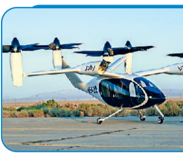
जॉबी एविएशन, अमेरिका की ईवीटीओल

चुका है। कई कंपनियां एयर टैक्सि शुरू करने की बिल्कुल व्यावहारिक योजनाएं बना चुकी हैं, तो कुछ देशों ने सर्टिफिकेशन की प्रक्रिया भी शुरू कर दी है। कहने का मतलब उड़ान कारें