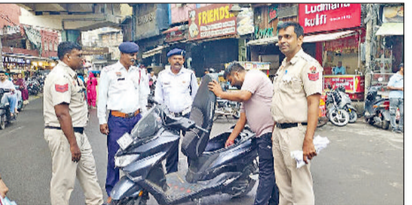
—30—जांच करते पुलिस की टीम।

सड़क पर आम जनता की सुरक्षा सर्वोपरि है और नशे की वजह से होने वाली दुर्घटनाओं को रोकना प्राथमिकता है। इस लिए ट्रैफिक पुलिस नियमित रूप से अभियान चलाती रहेगी और शराब पीकर वाहन चलाने वालों पर कोई भी छूट नहीं दी जाएगी