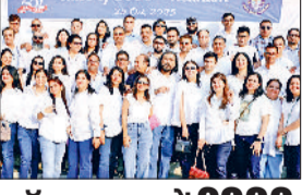
रोहतक। अंबेडकर चौक स्थित मॉडल स्कूल में वर्ष 2000 बैच के पास आउट विद्यार्थियों का रियूनियन समारोह बड़े हर्षोल्लास के साथ आयोजित किया गया।

मॉडल स्कूल में 2000 बैच के छात्रों ने रियूनियन समारोह में भाग लिया रोहतक। अंबेडकर चौक स्थित मॉडल स्कूल में वर्ष 2000 बैच के पास आउट विद्यार्थियों का रियूनियन समारोह बड़े हर्षोल्लास के साथ आयोजित किया गया। विद्यालय में हुए इस आयोजन में अधिकतर पूर्व विद्यार्थियों ने उत्साहपूर्वक भाग लिया और पुराने दिनों की याद करते हुए भावनात्मक पल साझा किए। कार्यक्रम में पूर्व विद्यार्थियों ने अपने शिक्षकों को भी आमंत्रित किया था। अपने पुराने विद्यार्थियों को देखकर सभी सेवानिवृत्त अध्यापकों के चेहरों पर प्रसन्नता और गर्व की विशेष चमक दिखाई दी। उन्होंने इस आयोजन के लिए विद्यार्थियों का आभार व्यक्त किया और उन्हें आगे भी जीवन में प्रगति करते रहने का आशीर्वाद दिया।