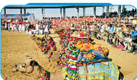
आयोजित होता है बहुत बड़ा पशु मेला

बड़ा मेला है। यहां समूचे भारत के ग्रामीण जीवन की जीवंत झंकाई देखने को मिलती है। राजस्थान के विभिन्न जिलों से लेकर इस मेले में हरियाणा, पंजाब, गुजरात और उत्तर प्रदेश तक के ग्रामीण लोग अपनी पारंपरिक वेशभूषा, गीत, नृत्य और हस्तशिल्प के साथ आते हैं। पुष्कर मेले में होने वाले लोकनृत्य प्रतिभागिताओं में मटकरी दौड़, ऊंट सजावट, ग्रामीण खेल, लोकसंगीत, कठपुतली, नाटक और पारंपरिक वाद्ययंत्रों की धुनें, भारत की विविधता में एकता का अद्भुत संदेश देती हैं। यह मेला वास्तव में ग्रामीण भारत की सजीव आत्मा पेश करता है। यहां महिलाएं पारंपरिक लहंगे, ओढ़नी आदि में सजी दिखती हैं और पुरुष रंग-बिरंगी पगड़ियों में सजते हैं। इसी वेशभूषा में ये लोग आयोजित होने वाले लोक गीत-संगीत के कार्यक्रमों में भाग लेते हैं। यहां की रंग-बिरंगी भीड़ वास्तव में भारत की जीवंत संस्कृति की धड़कन है, जिसने आधुनिकता के बीच भी अपनी जड़ें मजबूती से जमा रखी हैं।