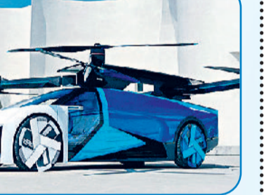
एक्सपेंस एयरोहॉट ईवीटीओल, चीन

सिर्फ सुरक्षा का ही नहीं, वास्तव में इन वाहनों की उड़ान और लैंडिंग की अनुमति भी एक बड़ी समस्या होगी, जिस पर इन दिनों